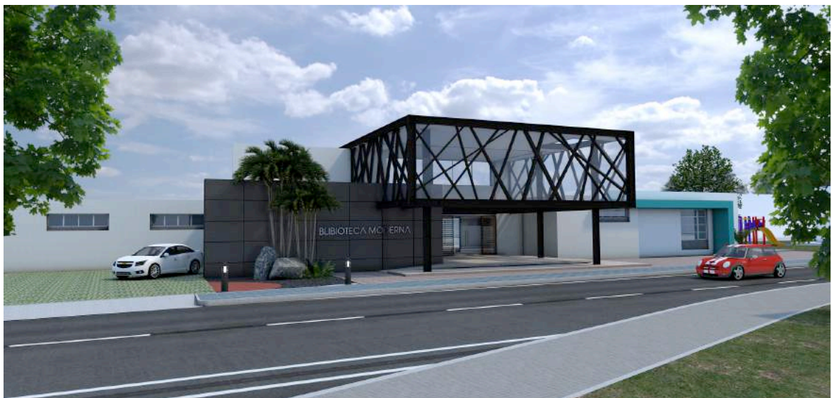
Ilustración 12: Propuesta Biblioteca en el Equipamiento Nodo la Luz.