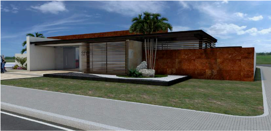
Ilustración 13: Propuesta Casa de Justicia en Nodo Equipamiento La Luz.