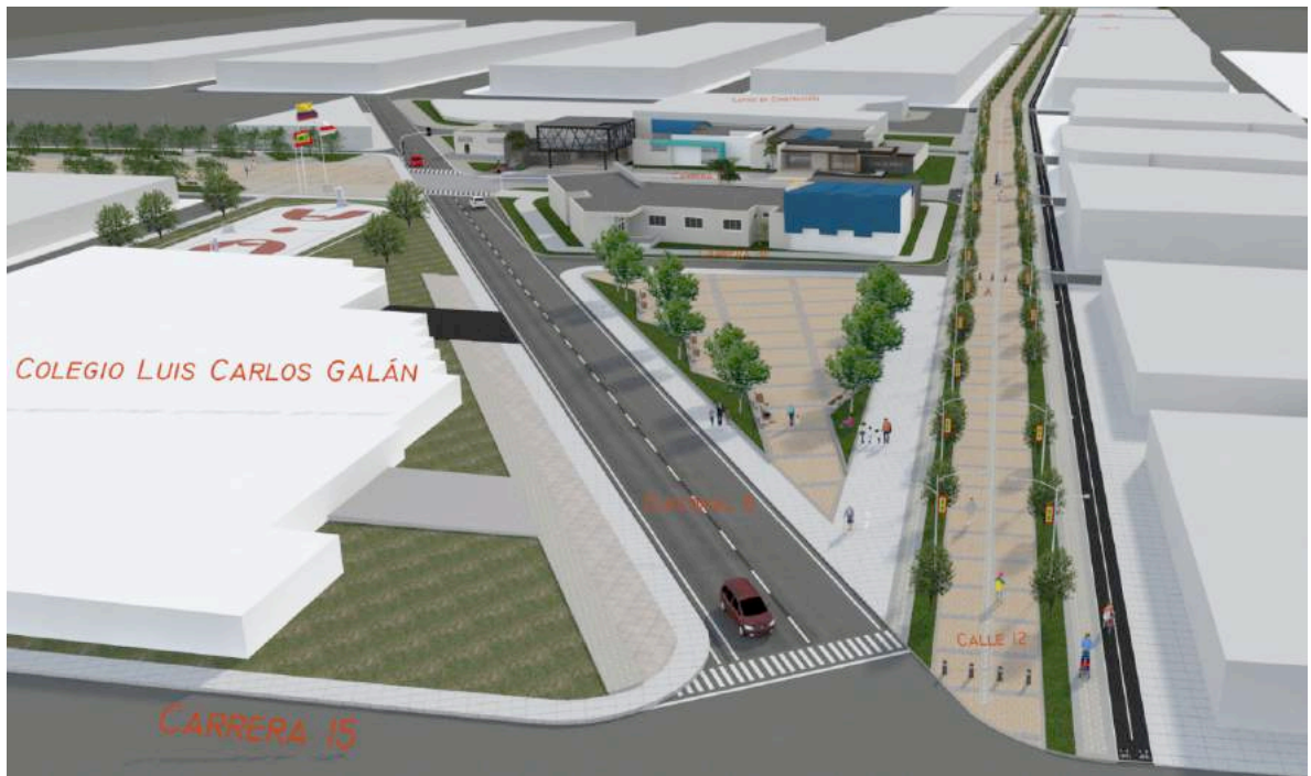
Ilustración 11: Propuesta Equipamiento Nodo La Luz vista hacia la Calle 12.