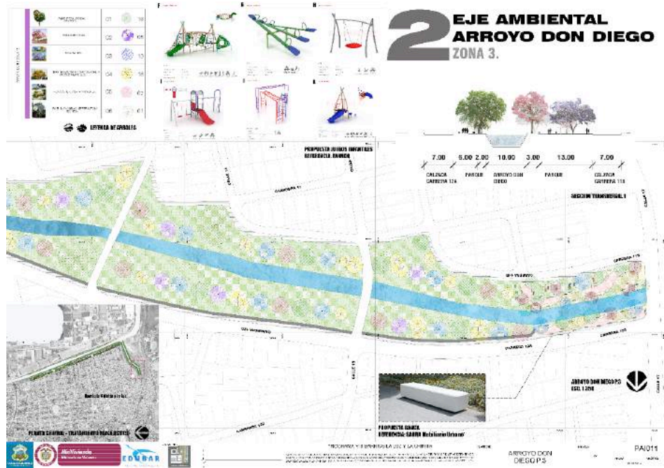
Ilustración 5: Propuesta Urbana Arroyo Don Diego la Chinita.