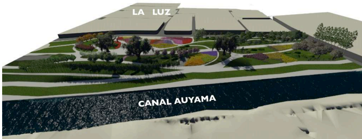
Ilustración 9: Propuesta Parque Lineal Caño de la Auyama.

El otro componente es el relacionado con el equipamiento social para lo cual a partir del diagnóstico socio-económico el plan propone dotar a los dos barrios de una infraestructura que supla las necesidades que hoy día tienen los barrios. En este sentido se plantean edificaciones escolares, deportivas, institucionales y de bienestar de tal forma que mejoren la calidad de vida de los residentes.