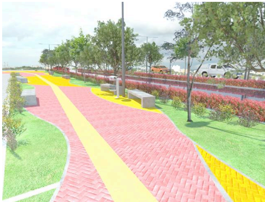
Ilustración 6: Propuesta Arroyo Don Diego la Chinita.

Otro soporte de la propuesta es el componente de movilidad tanto vehicular como peatonal. La propuesta apunta a mejorar las condiciones de movilidad de los sectores articulando la malla vial en sentido Norte - Sur y Este – Oeste que hoy día se trunca especialmente en el barrio la Chinita, estandarizando las vías y dotándolas con mobiliario urbano y señalización