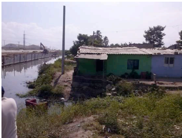
Ilustración 1: Barrio la Luz - Caño de la Auyama. Fuente EDUBAR S.A.

Se escogieron la Chinita y la Luz como pilotos para la aplicación del Programa de “Mejoramiento Integral de Barrios” en la ciudad de Barranquilla debido a su alto grado de riesgo y vulnerabilidad, ya que están situados a orillas del Caño de la Auyama y son atravesados por un caudaloso arroyo, sufriendo constantes inundaciones en cada temporada invernal. Además, ambos barrios presentan problemas de legalización y titularización de predios y la gran mayoría de las familias que allí habitan son de estratos socio económico uno y dos.