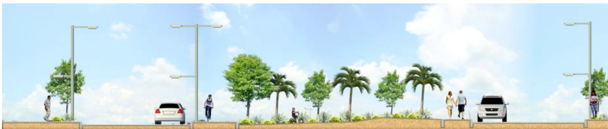
Ilustración 7: Separador verde borde Vía al Puente Laureano Gómez (Pumarejo).

con sus respectivos retiros y alineamientos para las futuras construcciones. De igual forma el proyecto plantea una nueva red peatonal que articule los dos barrios. Esta red peatonal será dotada de mobiliario urbano, y señalización y alumbrado. La red contará también con una ciclo ruta a través de la cual se podrá acceder a los diferentes espacios públicos y nodos de equipamiento comunal.