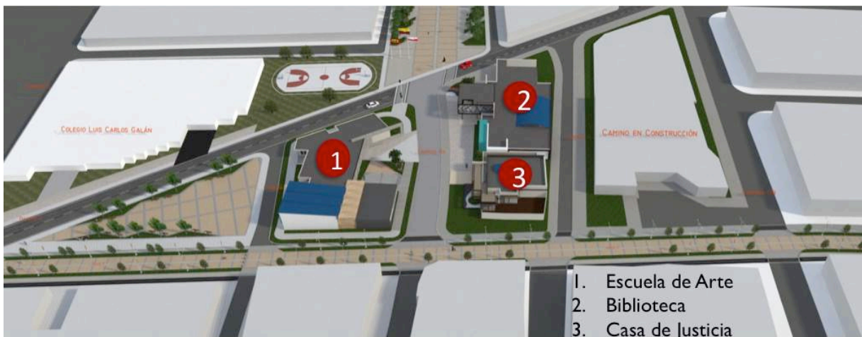
Ilustración 10: Propuesta Equipamiento Nodo La Luz.

El otro componente es el relacionado con el equipamiento social para lo cual a partir del diagnóstico socio-económico el plan propone dotar a los dos barrios de una infraestructura que supla las necesidades que hoy día tienen los barrios. En este sentido se plantean edificaciones escolares, deportivas, institucionales y de bienestar de tal forma que mejoren la calidad de vida de los residentes.