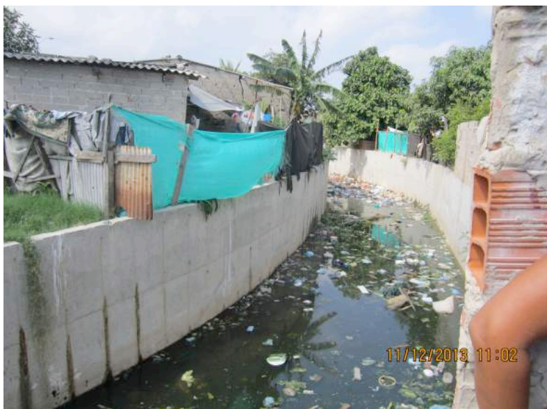
Ilustración 2: Barrio la Chinita - Arroyo Don Diego.

Edubar S.A. Por Contrato Interadministrativo No. 0106-2013-000054 firmado el 8 de noviembre de 2013 con la Alcaldía Distrital de Barranquilla, realizó “LOS ESTUDIOS URBANÍSTICO Y LOS ESTUDIOS Y DISEÑOS DEFINITIVOS PARA LA CONSTRUCCIÓN DE LAS OBRAS DE MEJORAMIENTO INTEGRAL DE LOS BARRIOS LA LUZ Y LA CHINITA EN EL DISTRITO DE BARRANQUILLA”.