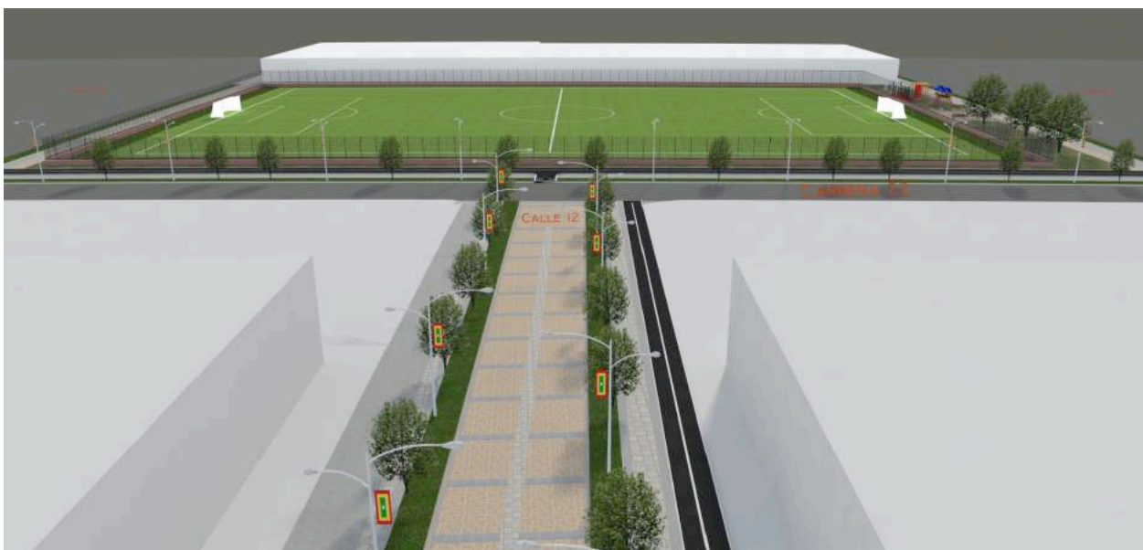
Ilustración 8: Calle 12 la Luz, al fondo la Cancha Barranquilla.

El componente de espacio público y equipamiento urbano es la respuesta a una de las necesidades que presentan los dos sectores. El plan propone un gran parque lineal paralelo al Caño de la Auyama que además de brindar alternativas diferentes de recreación a los residentes de los dos barrios y a los barranquilleros en general, va a cambiar la imagen urbana de la ciudad especialmente para los viajeros que utilizarán el nuevo Corredor Portuario otra alternativa vial de acceso a la zona de puertos y a la ciudad.