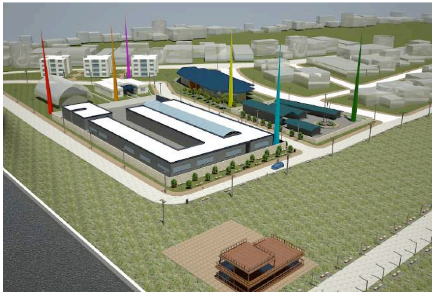
Ilustración 14: Propuesta Nodo Equipamiento El Milagro La Chinita.

En general el proyecto urbano propuesto para el sector que comprende los dos barrios está dirigido a cubrir las necesidades básicas en infraestructura urbana además de brindar a la población infantil, juvenil y madres cabeza de hogar opciones y oportunidades de mejorar como seres humanos.